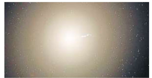
Die Riesengalaxie M87 wird eines fernen Tages einmal unsere Milchstraße verschlingen.