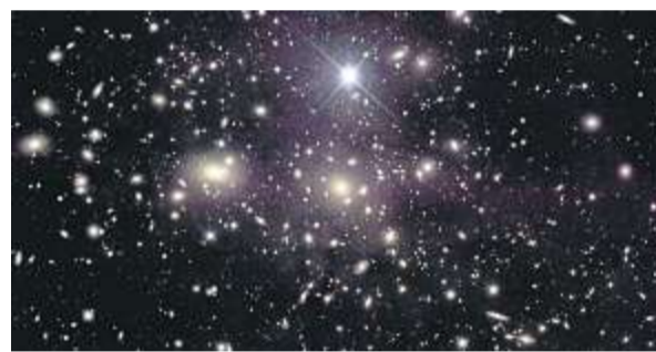
Der Coma-Haufen ist eine Ansammlung von vielen Tausend Galaxien in weiter Entfernung.