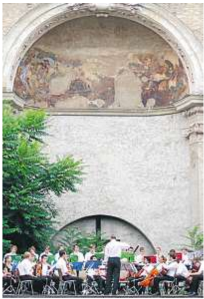
Die Regensburger Domspatzen gaben ein Konzert im mittelalterlichen Westchor der Obermünsterruine.